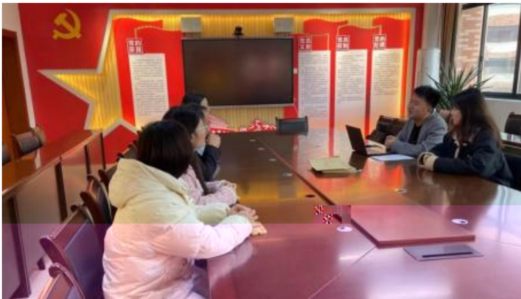
图 校企开展学术研讨项目交流会议

公 高度 队 的 ，充分 到 和 的关 ，对 高 和 关 的 。此公 供 ，包 更 、 方法 及 导 发 程，并 持 丰富 的 家 过 、 会 和 际 案 ， 队 分 的 和 。 常 地 活动， 包 参加 会 、 等 ， 促 问 的 分 ， ， 并 的 队 ( )。