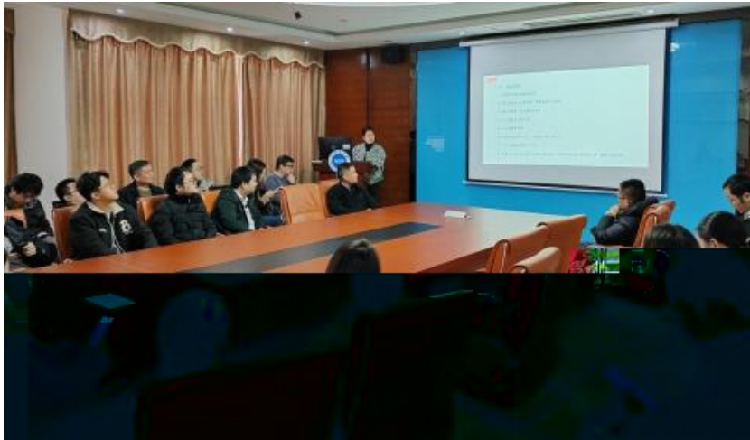
图 员工专业技能培训

，公 促 发 和 才 方 得 成 。 过 创 的 和 ， 不 动 公 的 持 成长， 工 供 的发 机会。 过 供多 化的 和发 ， “ 队 共 ” 等 活动 ( )， 帮 工 ( 技 和管 ； 并 的 和 规划， 工的 合 和 ， 包 导 发 计划、技 技 及 部 等， 地促 工的 方 发 。